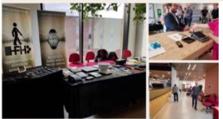
Billedtekst: situationsbilleder fra messen

Vi har fået rigtig mange positive tilbagemeldinger, både fra besøgende og udstillere. Planlægningen af NS2019 er allerede i fuld gang.