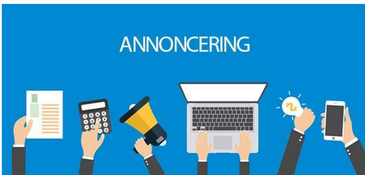
Billedtekst: Annoncering på forskellige måder