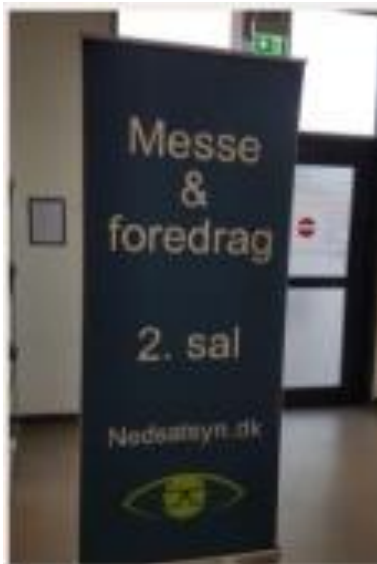
Billedtekst: Skilt med tekst Messe og foredrag 2. sal

Du kan se mange flere billeder og video på facebook.