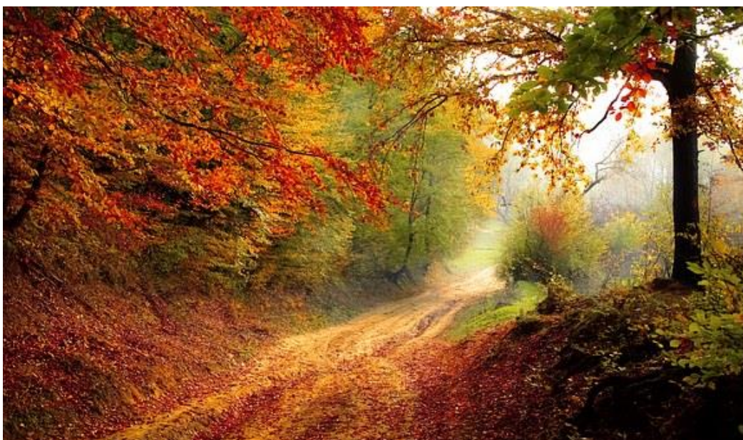
Billedtekst: naturen i efterårsfarver