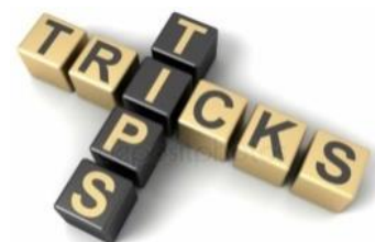
Billedtekst: Tips og tricks

Har du et godt tip eller tricks som andre kan have glæde af? så send en mail til nedsatsyn@gmail.com