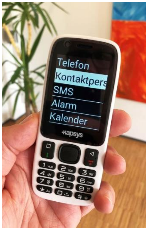
Billedtekst: MiniVision telefon

Er du ikke medlem af Nedsatsyn.dk, skal du blot melde dig ind og dermed får du mulighed for at benytte dette tilbud. Rabatten gælder ved alle typer af medlemskaber, se mere på http://www.nedsatsyn.dk/bliv-medlem/ . Medlemskaberne koster fra 100 kr og opefter, og gælder et år fra indmeldelsen. Prisen på MiniVision er 3700 kr., rabat 370 kr, pris nu kun 3230 kr.